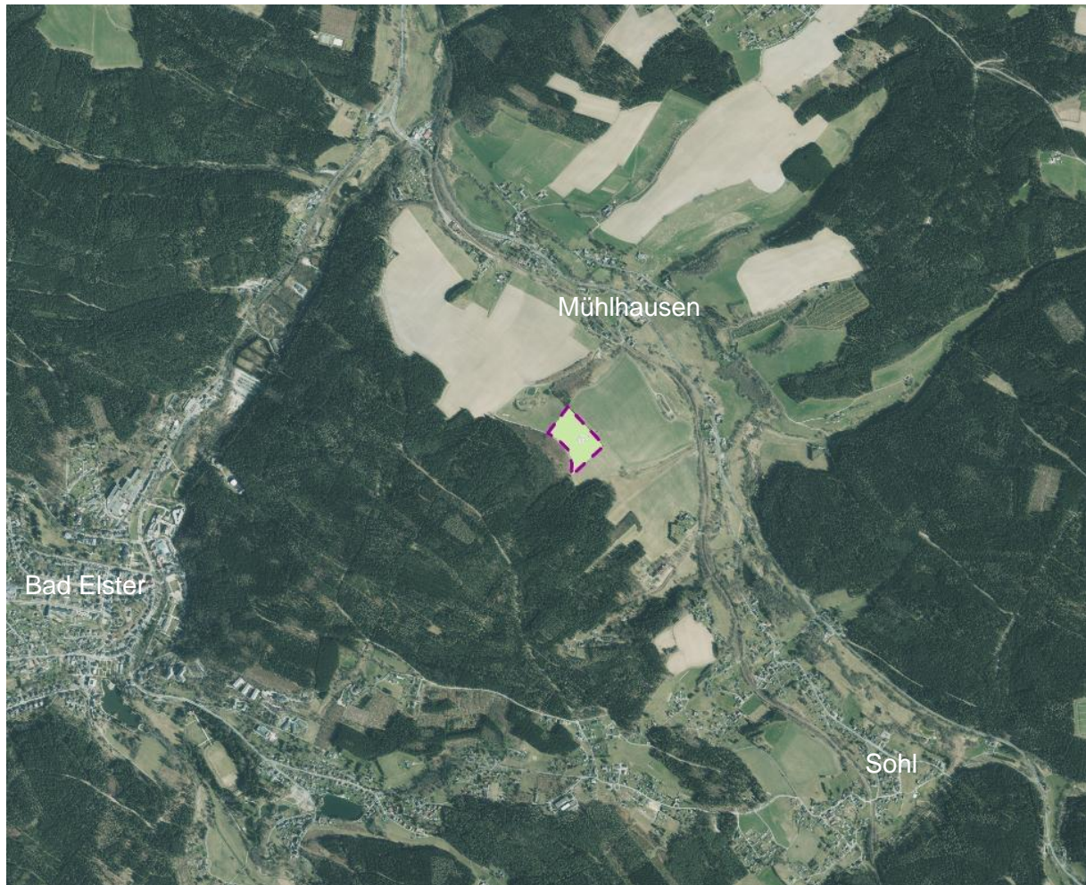
Lage der Maßnahmenfläche