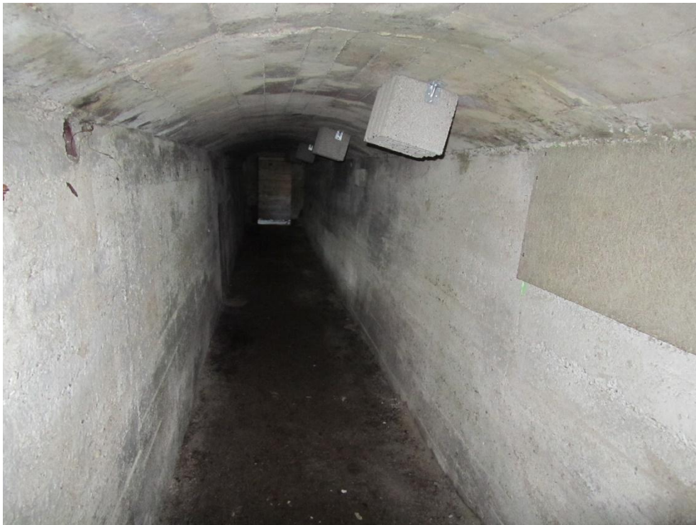
Fledermaussteine und „Sauerkrautplatte“ im Quartier